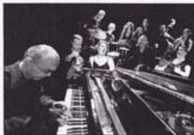
Le festival débute vendredi 31 juillet à 20h30 à la salle polyvalente de Saint-Benoit du Sault par un concert des « Voice messengers ».

l'Europe, qui allie le swing et l'énergie d'un grand orchestre de jazz. Parmi les autres rendez-vous, citons « Monsieur Satie, l'homme qui avait un petit piano dans la tête », mercredi 5 août à 17h, un spectacle tout public à voir à partir de 6 ans. Ou encore « Musique de placard », samedi 8 août à 20h30, un spectacle qui mêle des textes de Diablogues de Dubillard et des scènes extraites d'ouvrages d'Offenbach.