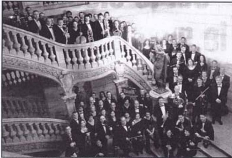
L'orchestre symphonique de la Région Centre Tours, au Blanc le 14 août et à St-Gaultier le 16 août.

Depuis sa création en 2005, le festival des Bouchures - le nom donné aux haies en Berry - revendique haut et fort son ancrage sur un territoire, le Boischaud sud. Cette cinquième édition va rayonner sur tout le sud du département.